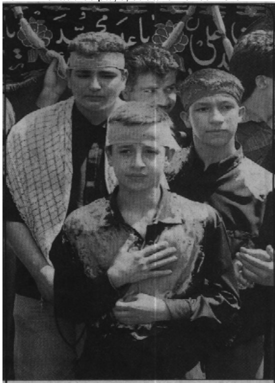
Un adolescent influencé par les croyances superstitieuses et les agitateurs du régime de la RII au cours du mois de moharam (mois sacré chez les Chiïtes – 1er mois de l'année lunaire musulmane). Ils se couvrent de fleurs en espérant bien protéger la ligne des fondamentalistes.

A cause du rôle et de l'importance du régime de la RII dans la formation du phénomène hezbollah (les chiïtes partisans de la RI), à cause du rôle idéologique des Frères Musulmans en Egypte et dans d'autres pays, et dans l'ensemble