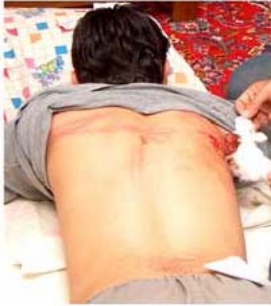
En Iran, la torture est monnaie courante!!!

réforme et le réformiste a un sens différent. Face à la population et au mouvement d'opposition, qui étaient les principales forces dans le renversement du régime