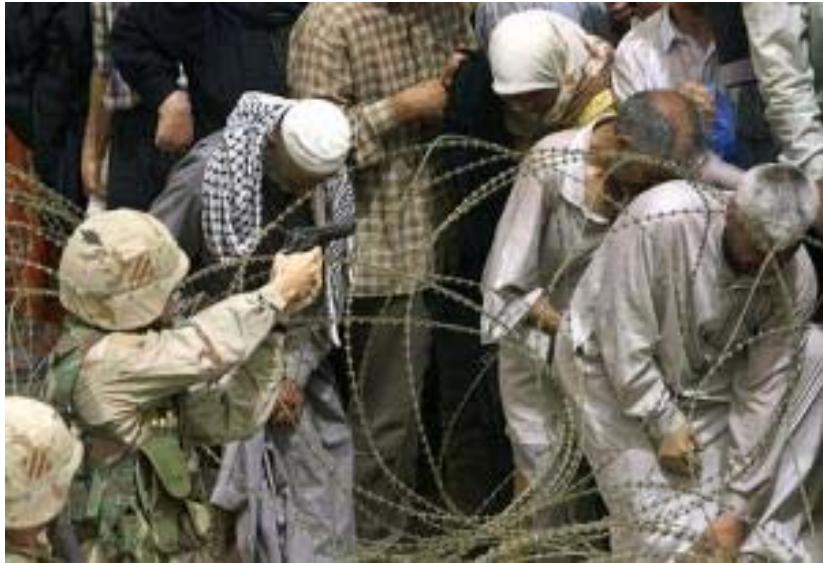
Arrogance et Brutalité coutumière des américains en Irak

"l'axe de mal", craint le projet nucléaire du régime iranien. Suite à l'influence et à la provocation permanente de l'Etat d'Israël et des milieux sionistes présents à la Maison Blanche, l'inquiétude américaine s'accroît régulièrement. Ce qui n'est pas clair, c'est comment l'Etat d'Israël peut avoir la légitimité de posséder des armes nucléaires et les autres pays devraient en être privés. Cet Etat avertit régulièrement les pays