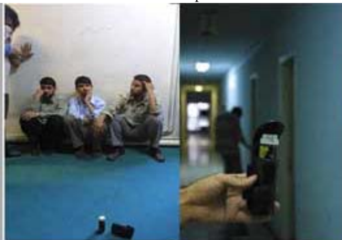
Plusieurs membres d'un groupe d'Hezbollah entrent dans les dortoirs des étudiants et en criant « vive le guide et vive l'islam », ils cassent les portes des chambres des étudiants, afin de pouvoir jeter ces derniers par les fenêtres.

postes dans l'organe exécutif, ils ont préféré se grouper autour de Khatami. A part Abdollah Nourri qui a persisté sur son opposition avec Khamenei, les