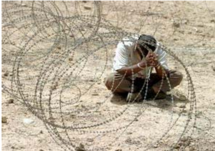
Scène quotidienne d'humiliation du peuple irakien par les Américains

qu'il fut obligé de l'amener à l'hôpital Jorjani. Il a ajouté qu'après quelques heures, quand sa mère a repris conscience, ils sont rentrés à la maison avec une poche pleine de médicaments. Après cet homme, une femme d'une quarantaine d'années, qui était assise devant moi, a pris la parole avec nervosité : nous pensions que les Américains étaient des gens corrects, normaux et valables. Mais apparemment, c'est le contraire.