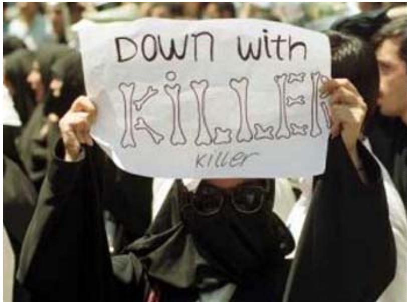
Scène de manifestation contre le régime en Iran

geoisie commerciale (bazar). Les rares propos prononcés par les dirigeants de cette fraction concernant les changements,